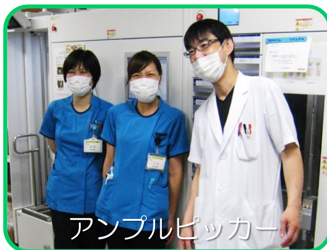
アンプルピッカー