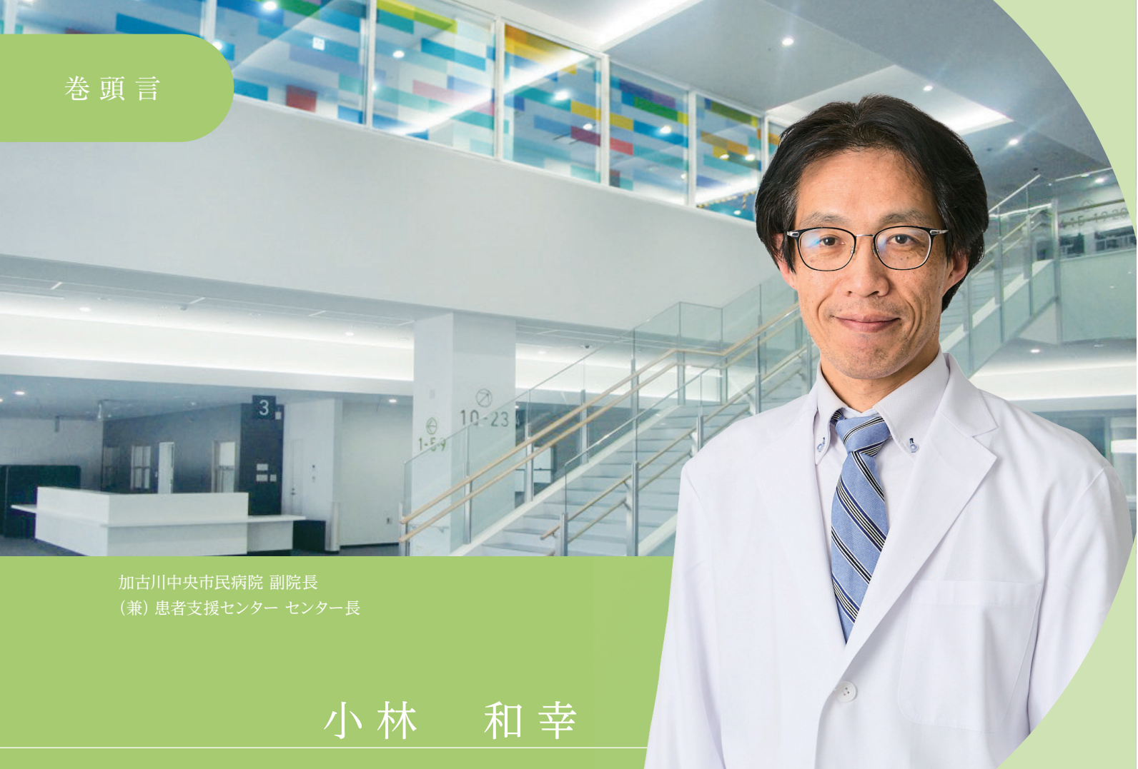
加古川中央市民病院 副院長 (兼) 患者支援センター センター長