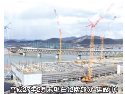
平成27年2月末現在(2階部分 建設中)