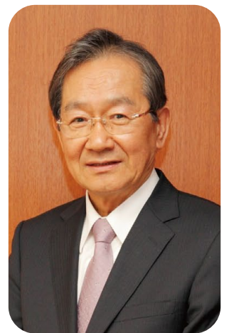
地方独立行政法人 加古川市民病院機構 理事長

理事長 「分かりました。質の高い医療はもちろん、同時に心の通う医療を大事にし、地域の医療機関と連携をとりながら全スタッフ一体となって、地域の皆さんに『良い病院が出来て本当に良かった』と感じていただけるよう、引き続き取り組んでいきたいと思っています。」