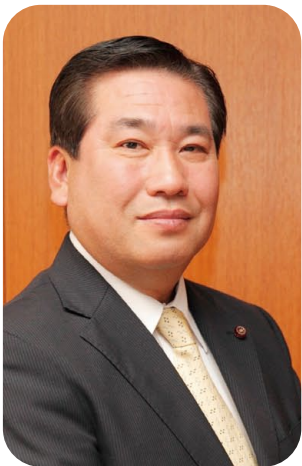
加古川市議会 第64代議長